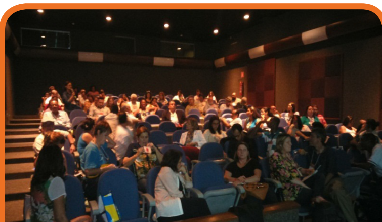
Reunião da Rede de Gestores na III CONAES – Brasília/DF – 28/11/14

para participar da III Conaes, num total de 365 vagas disponibilizadas.