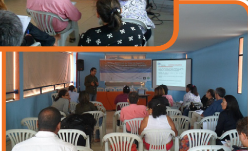
Oficina Regional do CO – Brasília/DF – 10 e 11/10/14