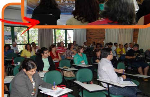
Oficina Regional SE – Vitória/ES – 25 e 26/09/14