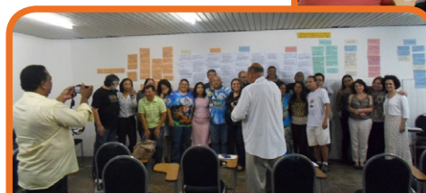
Oficina Nacional – Campinas/SP – 09 a 12/11/14