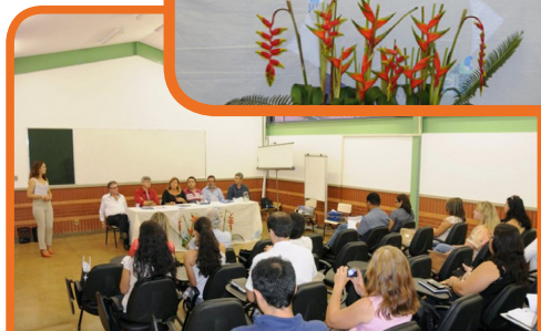
Oficina Regional do Norte – Palmas/TO – 15 e 16/09/14