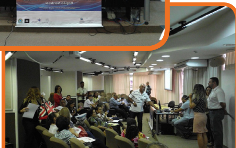
Oficina Regional do Nordeste – Salvador/BA - 18 e 19/09/14