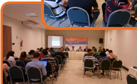
Oficina Regional do Sul – Itajaí/SC – 22 e 23/09/14

Secretaria Executiva: Av. Luís Viana Filho, 2ª Avenida, Plataforma III, nº200, CAB, Salvador - BA, CEP 41745-003 Tel.: (71) 3115-9945 Email: rede_gestores@yahoo.com.br